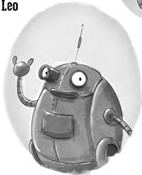
Albert Tante Agnethas Haushaltsroboter