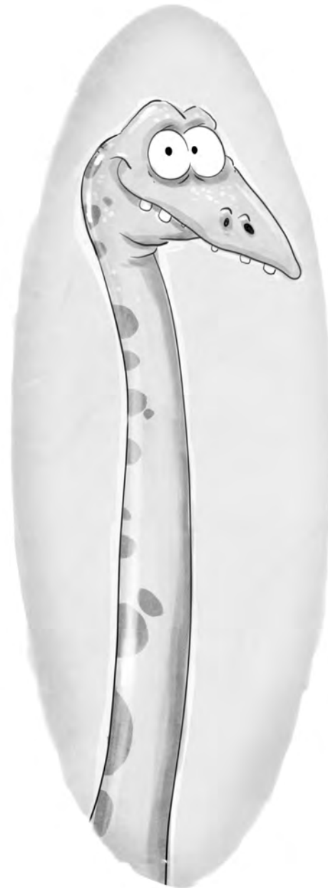
Klemens ein Apatosaurier