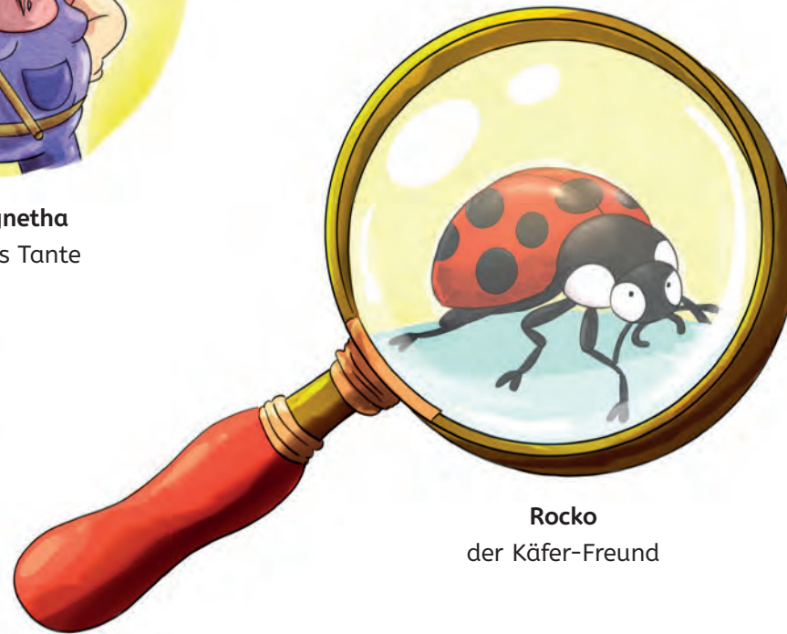
Rocko der Käfer-Freund