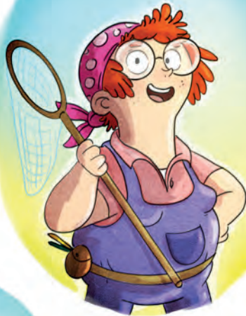
Agnetha Leos Tante